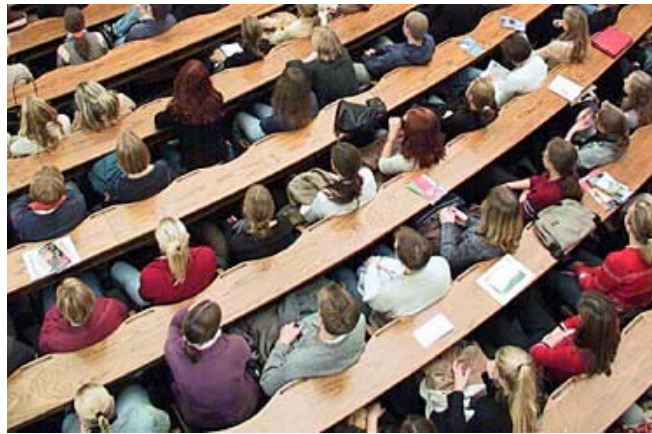
Students in a lecture hall